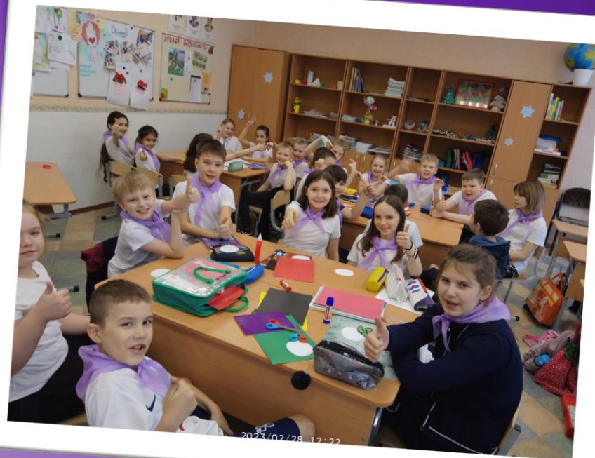
Участие орлят в подготовке поздравительных открыток для пожилых людей в Дом престарелых