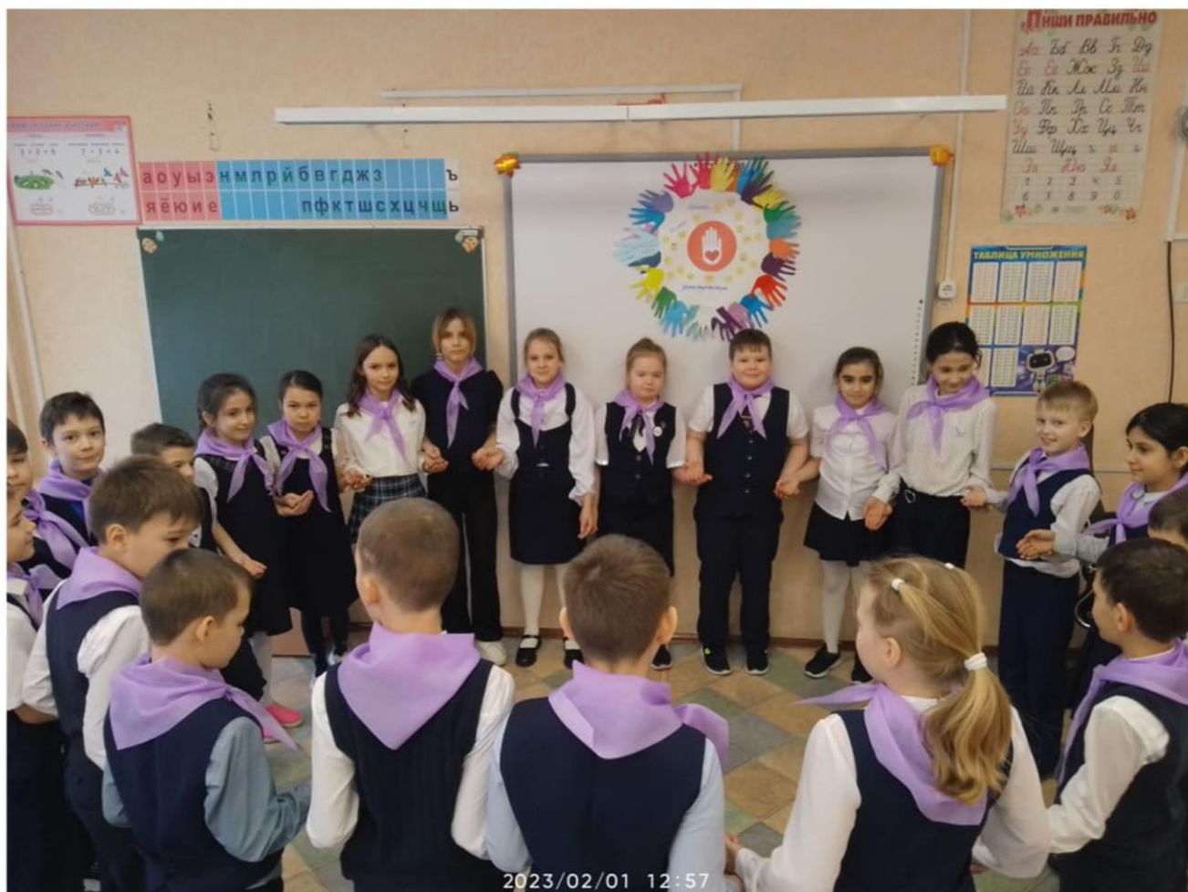
Орлята МОУ СОШ №3