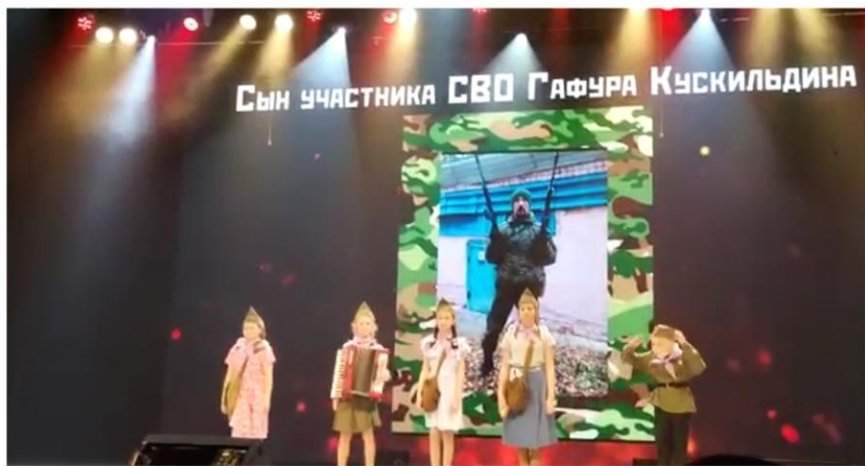
Выступление на благотворительном концерте «Если дорог тебе твой дом»