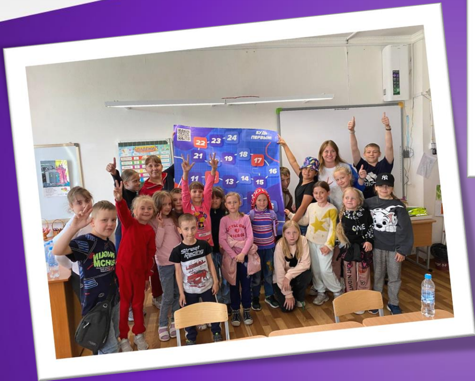
Боле бо детей приняли участие в смене «Орлята» школьного оздоровительного лагеря МОУ СОШ №3