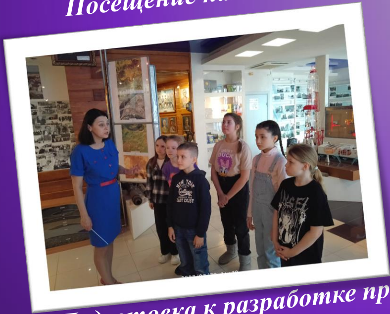
Подготовка к разработке проекта «По историческим местам»