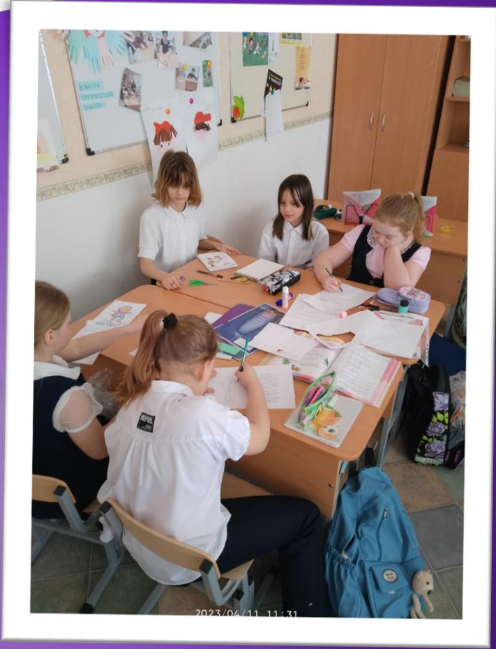
7 участников программы оформили проект «Моё первое стихотворение»