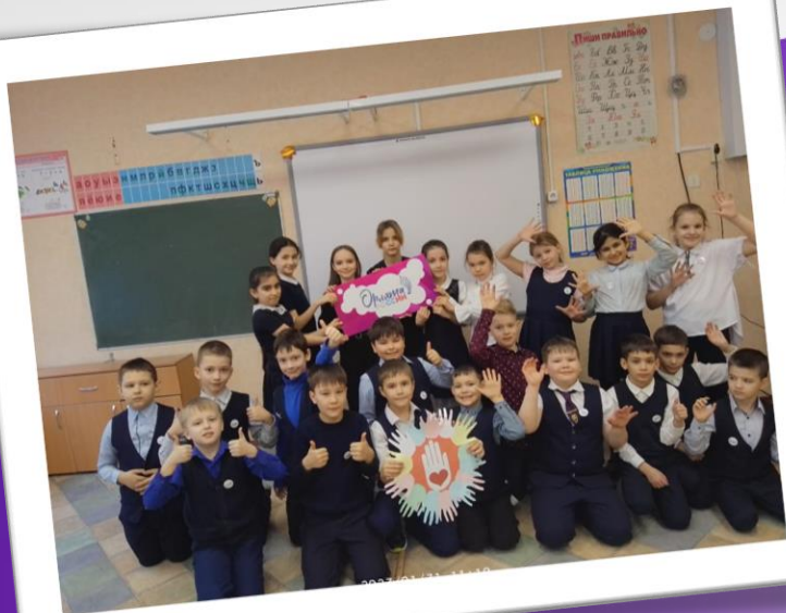
Мини-проект «Круг Добра»